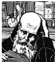
Pelagio (354-420/440 d.C.)

Porque los que son de la carne piensan en las cosas de la carne; pero los que son del Espíritu, en las cosas del Espíritu... por cuanto los designios de la carne son enemistad contra Dios; porque no se sujetan a la ley de Dios, ni tampoco pueden(Romanos 8:5, 7)