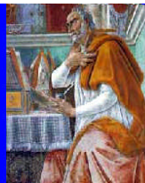
Agustín de Hipona (354-430 d. C.)