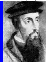
Juan Calvino (1509-1564)

En los siglos 16 y 17 el Pelagianismo volvió a cobrar relevancia teológica con una nueva apariencia y con